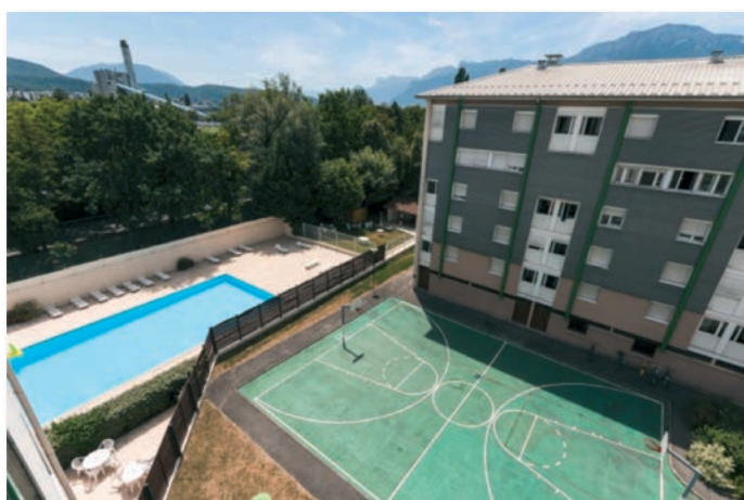
Terrain de basket