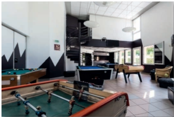
Salle de jeu